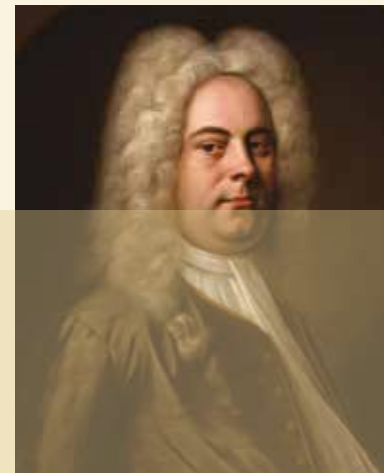
George Frideric Handel (1685-1757)