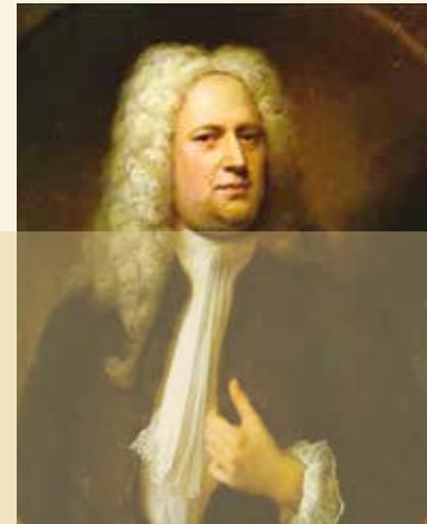
Johann Kaspar Ferdinand Fischer (1665 ca. - 1746 ca.)

Giovan-Battista Salvi detto il Sassoferrato Madonna orante