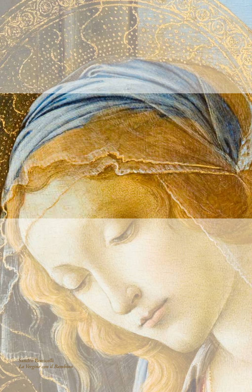
Sandro Botticelli La Vergine con il Bambino