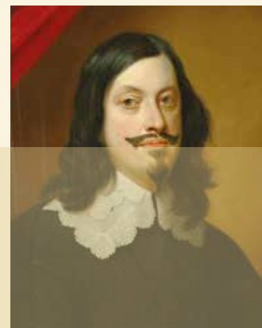
Johann Jakob Froberger (1616-1667)