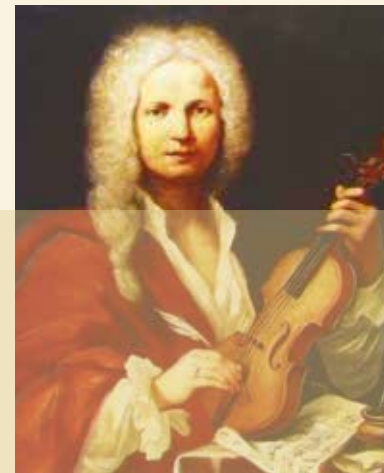
Antonio Vivaldi (1678-1741)

Filippo Lippi Madonna col Bambino e due angeli