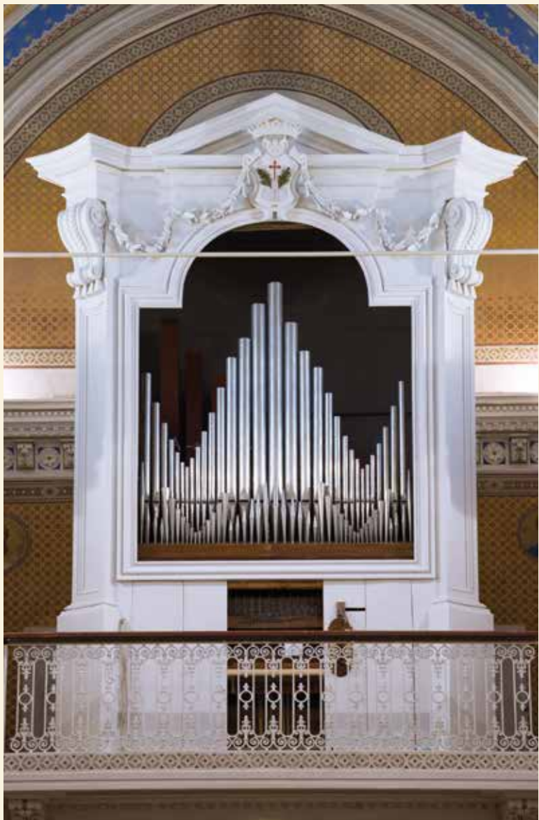
L'organo Adamo Rossi (1791) della chiesa di San Bartolomeo, Solomeo

L'organo Adamo Rossi, conservato presso la chiesa parrocchiale di San Bartolomeo a Solomeo, fu costruito dall'organaro perugino Adamo Rossi nel 1791.